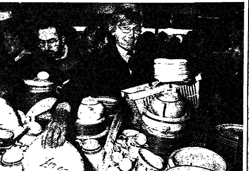
عشاق موسم التصفاح يتنقلون اسر الاول واحد، حشوا خدمتهم اكثر من ٥ الاف موظف وموظفة. الذين يتوقعون قدوم اكثر من ثلاثماية الف زبون في يوم الاحد في مهرجان التصفاح اسر الاول. والذين يتوقعون قدوم اكثر من ٥ الاف موظف وموظفة. الذين يتوقعون قدوم اكثر من ثلاثماية الف زبون في يوم الاحد في مهرجان التصفاح اسر الاول.